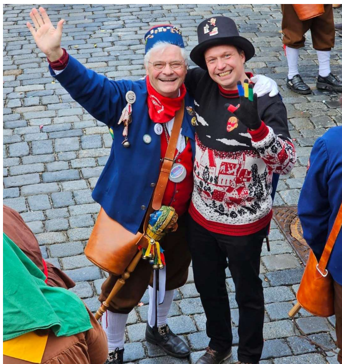
Mit dem Narrenverein Hohentengen-Beizkofen

in Trochtelfingen durften wir einen stimmungsvollen Fasnetsumzug erleben – mit wunderschönen Laufnarren und dem einen oder anderen kreativ gestalteten Festwagen.